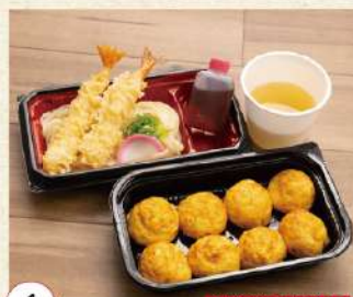
6 玉子焼と海老天盛りうどん