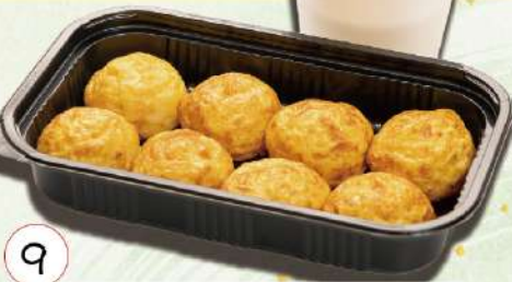
9 名物玉子焼 (明石焼)