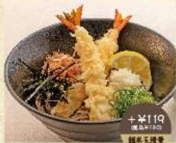
+¥119 (税込¥130) 麺半玉増量