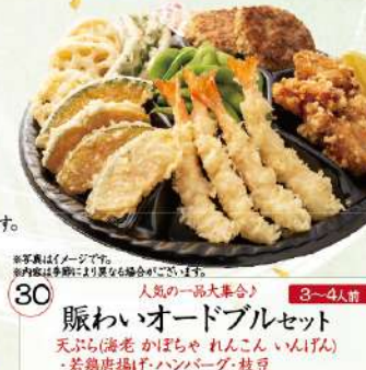
30 賑わいオードブルセット 天ぷら(海老 かぼちゃ れんこん いんげん) ・若鶏唐揚げ・ハンバーグ・枝豆