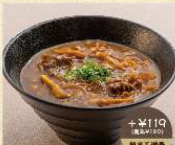
+¥119 (税込¥130) 麺半玉増量