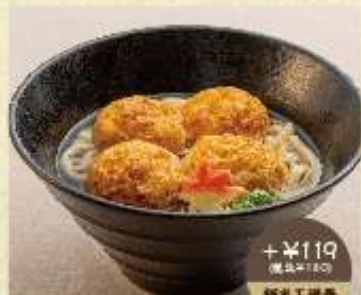
+¥119 (税込¥130) 麺半玉増量