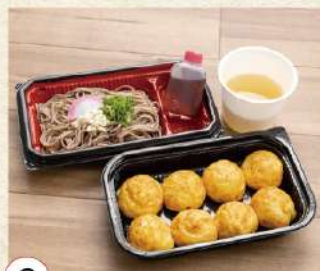
8 玉子焼と冷やしそばセット