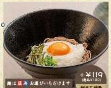
+¥119 (税込¥130) 麺半玉増量