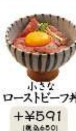
小さな ローストビーフ丼 +¥591 (税込¥650)