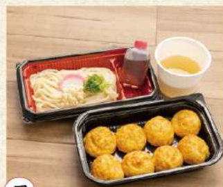
7 玉子焼と冷やしうどんセット