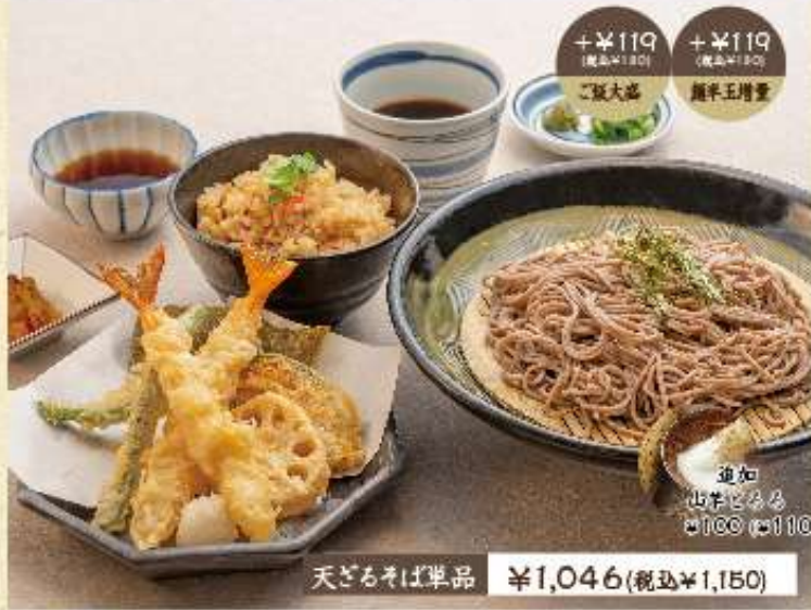
天ざるそば単品 ¥1,046(税込¥1,150)

大事なのは麺の旨さとお出汁。 ひまわりでは店内で出汁も仕込んでいます。 昆布とカツオの合わせ出汁。