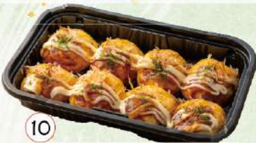
10 餅とチーズの玉子焼