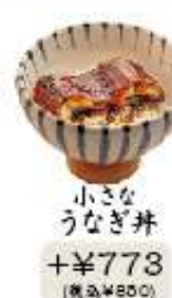
小さな うなぎ丼 +¥773 (税込¥850)