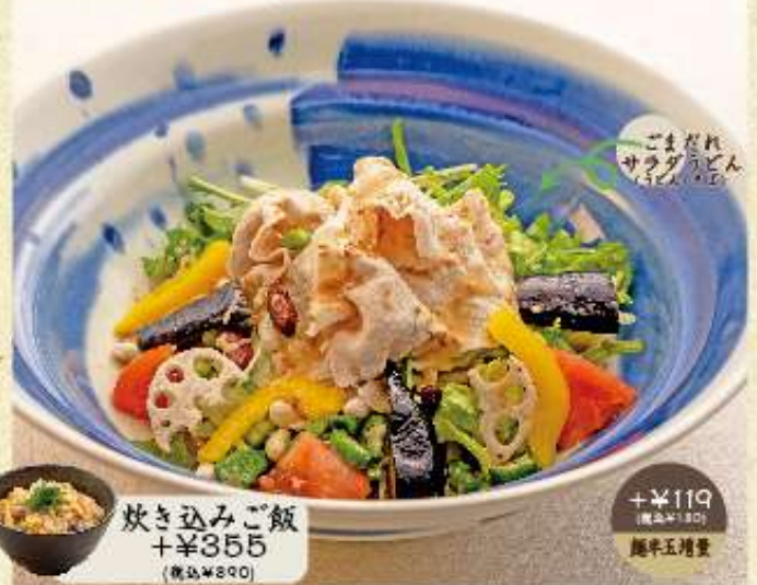
炊き込みご飯 +¥355 (税込¥390)