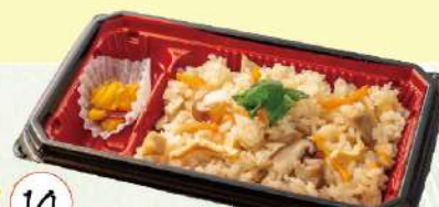
14 季節の炊き込みご飯