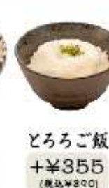
とろろご飯 +¥355 (税込¥390)