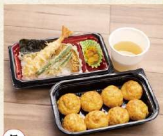
5 玉子焼と天井セット