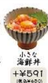
小さな 海鮮丼 +¥591 (税込¥650)