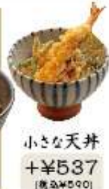
小さな天井 +¥537 (税込¥590)