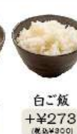
白ご飯 +¥273 (税込¥300)